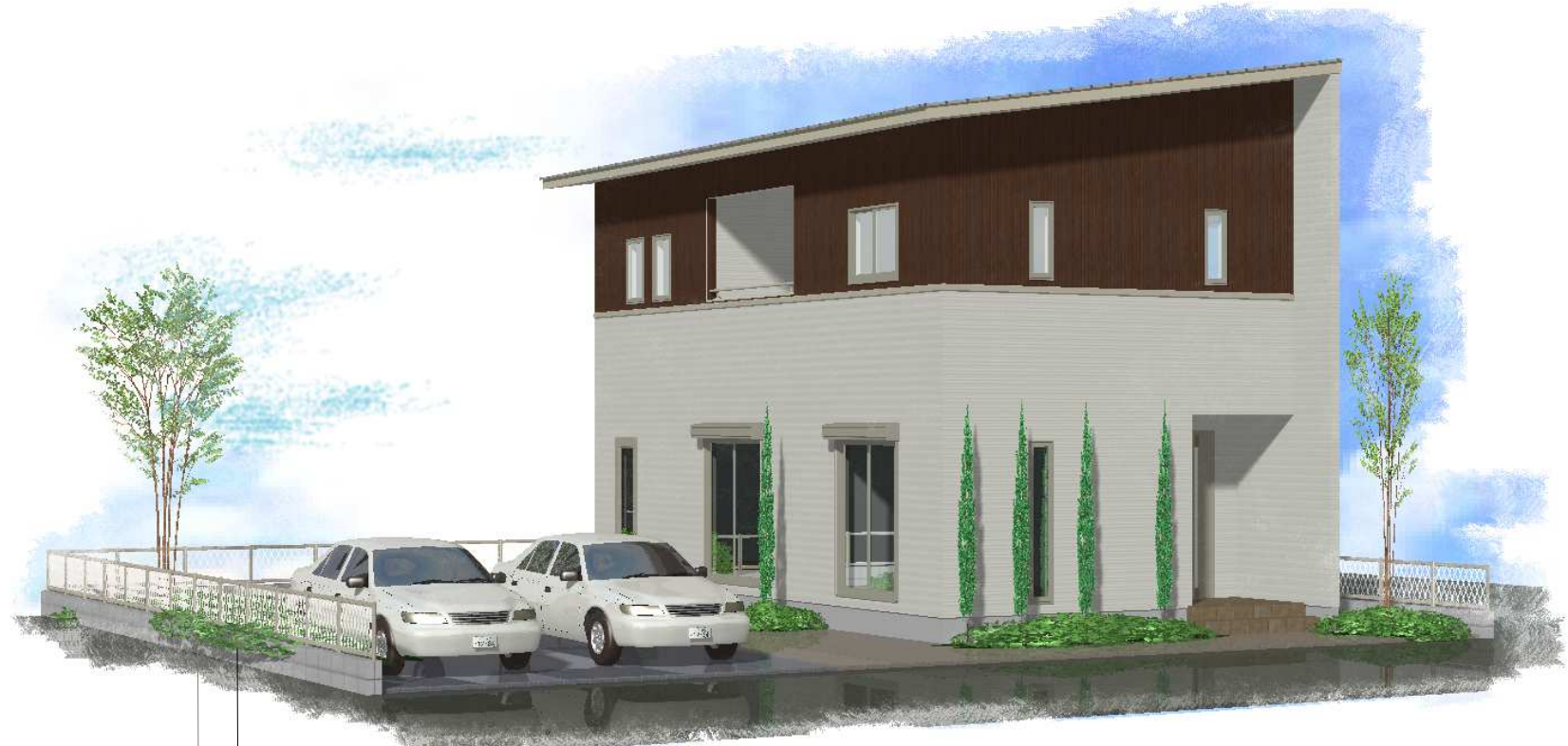
外観イメージパース